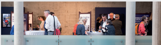
Impressionen des Symposiums